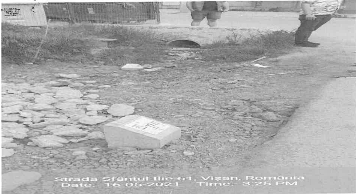
Foto / rigola infundată

În luna mai la întâlnirea cu cetățenii de pe strada Emil Palade din sat Pietrăria, am decis să depunem un proiect HCL- extindere canalizare. Proiectul a fost depus in data de 11.05.2021(9557.)