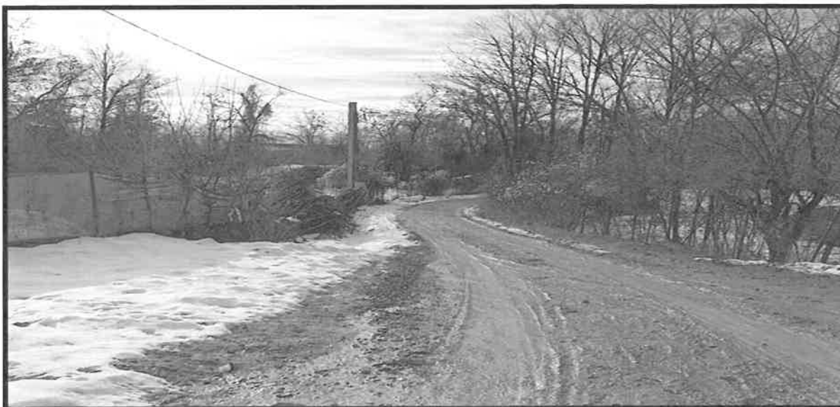
Strada Prof. Mihai Cojocaru/Pietrăria

Impreună cu colegi mei din USR, am întocmit Proiectul de hotărâre privind , extindere rețea canalizare și racorduri în strada Cezar Petrescu, sat Păun (10.06.2021).